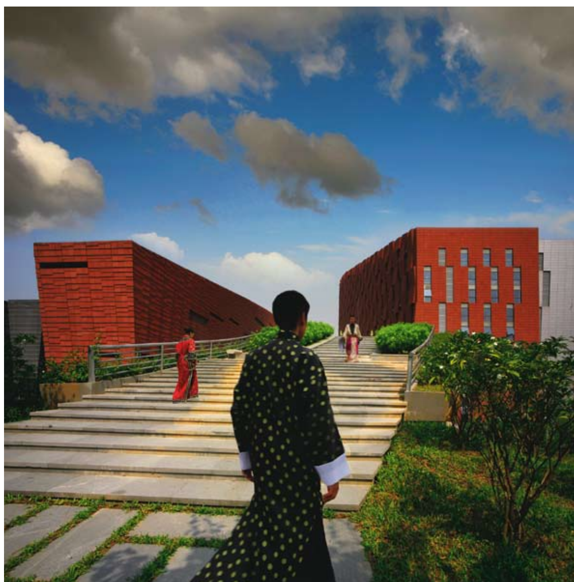
Ecobruggen over de snelweg maken de verbinding tussen het centrum en de omliggende bergen

Het Baiyun International Convention Centre is een mooi voorbeeld van een duurzaam concept. Er werd niet alleen gebruik gemaakt van lokale bouwmaterialen zoals de typische Chinese rode zandsteen, maar er was ook aandacht voor de lokale geschiedenis, de cultuur en de symbolen van de stad. Hierdoor is het gebouw volledig verankerd. De architecten van BURO II kozen bovendien ook voor een nauwe samenwerking en interactie met de Chinese partner. Het congrescentrum is een meetingpoint geworden tussen het oosten en het westen. Deze interculturele en multidisciplinaire teambenadering is een succes gebleken die ook op het World Architecture Festival werd gesmaakt.